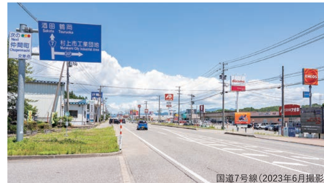
国道7号線(2023年6月撮影)