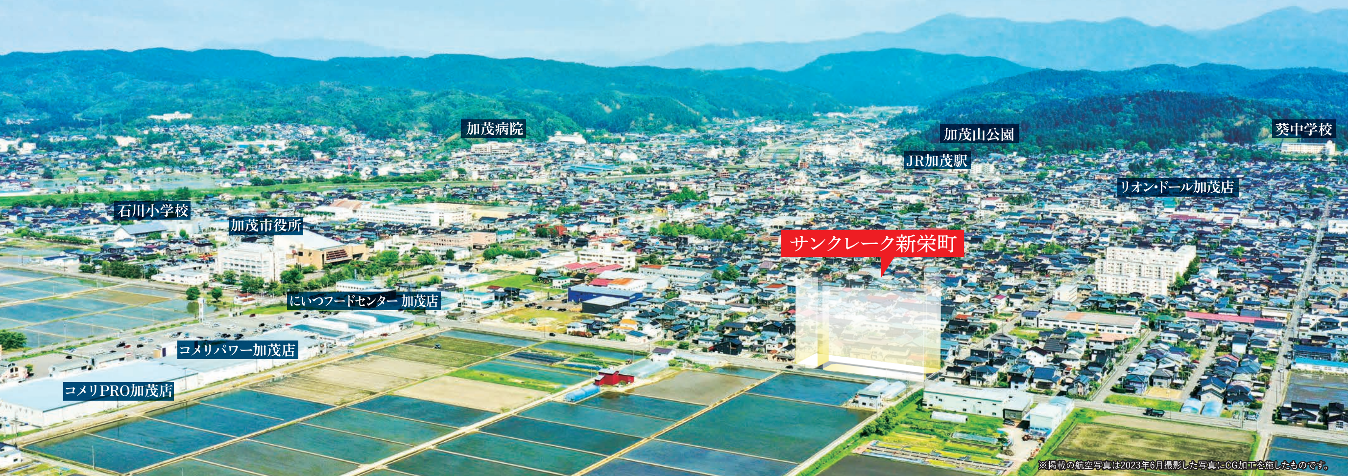
※掲載の航空写真は2023年6月撮影した写真にCG加工を施したものです。