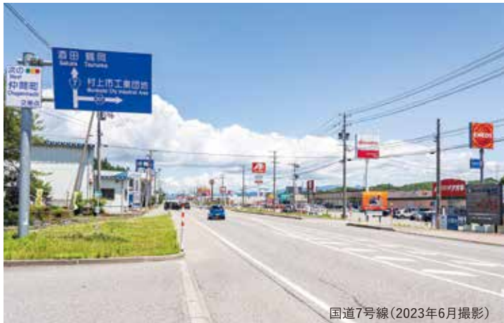
国道7号線 (2023年6月撮影)