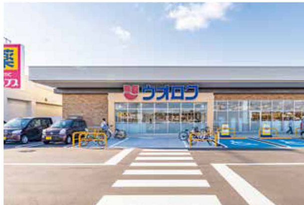
ウオロク空港通店