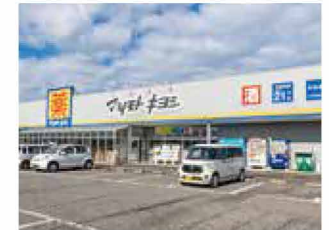
マツモトキヨシ空港通店 車で 3分