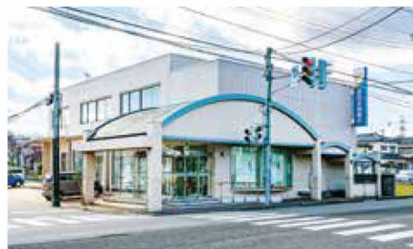
第四北越銀行物見山支店 車で3～4分