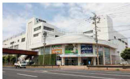
新潟市東区役所 車で11分