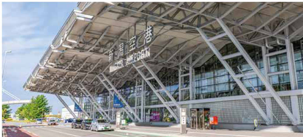
新潟空港 車で7分 2,500メートルの滑走路を備え、日本海側の拠点空港としてその機能を果たしています。国内線7都市9路線、国際線4路線の定期便と多くのチャーター便・臨時便が運航しています。