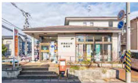
船江町郵便局 徒歩 6～9分