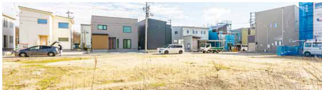
サンクレーク船江町2丁目 現地(2024年1月撮影)

新しいコミュニティで新生活がスタートできます。 同じ時期に入居する世帯が多く、自分たちで新しいコミュニティを つくっていくことができます。街区内公園はの居住者の利用を視野に 入れ、コミュニティ形成の役割も期待しています。