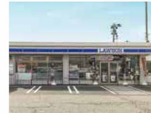
ローソン空港西二丁目店 徒歩 6～9分