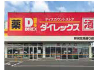
ダイレックス新潟空港通り店 車で 3分