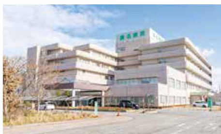
桑名病院 徒歩 8～10分