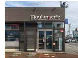
ブーランジェリー カワムラ 車で 3～4分