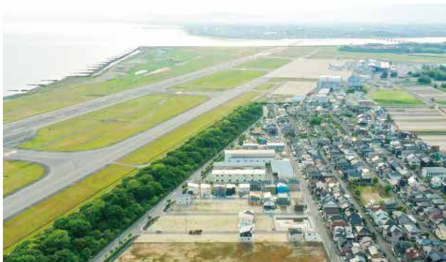
サンクレーク船江町2丁目 現地(2023年6月撮影)

「分譲地」をおすすめする理由があります。そこは人が住み、営み、はぐくむ街であると私たちは考えています。街とそこに暮らす人々との未来を思い描きながら、私たちが選定し、最適に区分しているのが、日生の分譲地「サンクレーク」です。