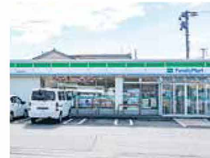
ファミリーマート新潟船江町店 徒歩 4～6分