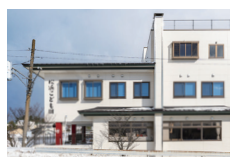
松浜こども園 徒歩13～14分