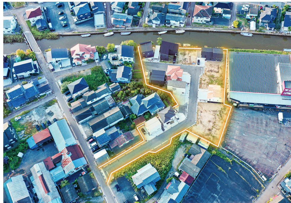
※掲載の航空写真は2023年10月撮影した写真にCG加工を施したものです。

「分譲地」をおすすめする理由があります。そこは人が住み、営み、はぐくむ街であると私たちは考えています。街とそこに暮らす人々との未来を思い描きながら、私たちが選定し、最適に区分しているのが、日生の分譲地「サンクレーク」です。