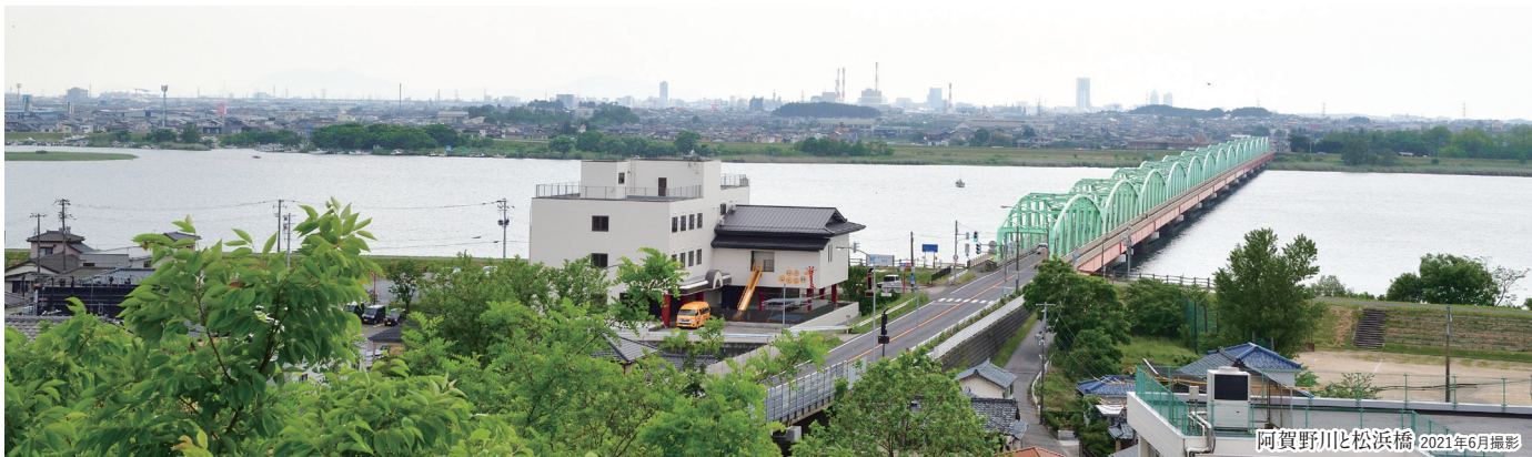
阿賀野川と松浜橋 2021年6月撮影

落ち着いた暮らしやすい住宅地でありながら、 新潟市中心部や周辺地域へアクセスしやすい好立地。