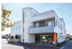
あがのこども園 徒歩6～7分