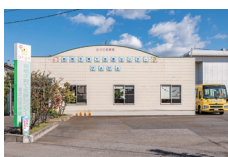
地域子育て支援センターびびよ 徒歩6～7分