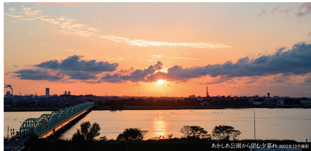
あかしあ公園から望む夕暮れ 2022年10月撮影