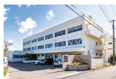
新潟市北地区公民館 徒歩10～11分